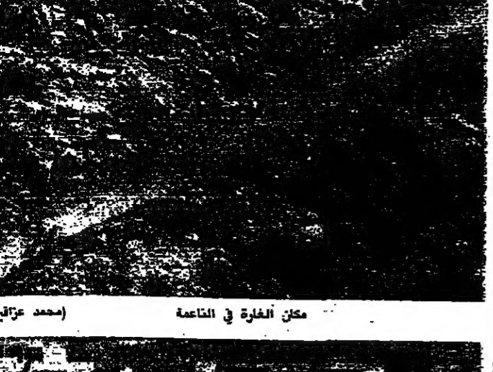
مكان الغارة في الناعمة (محمد عزائق)